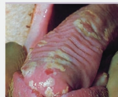
Αλλοιώσεις στη γλώσσα χοίρου