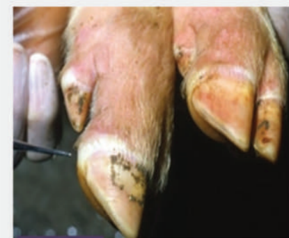
Αλλοιώσεις στη στεφάνη άκρου χοίρου