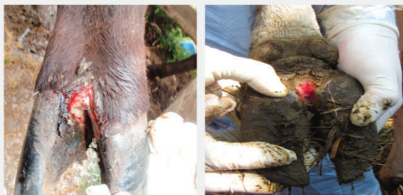
Έλκος στο μεσοδακτύλιο διάστημα ύστερα από φυσαλίδα που έχει διαρραγεί