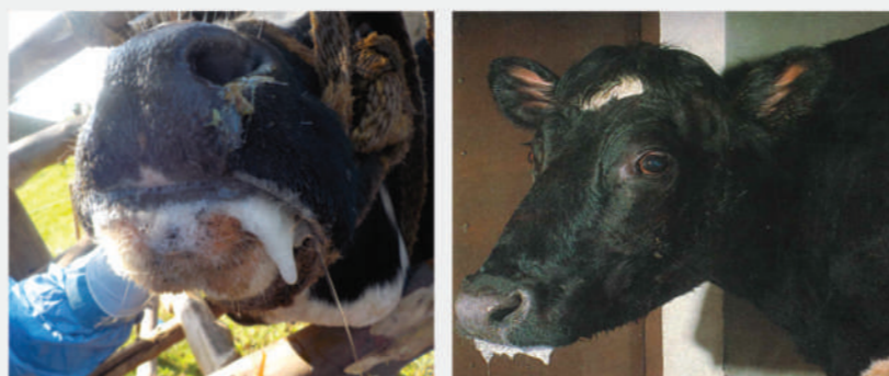
Έντονη σιελόρροια σε βοοειδές