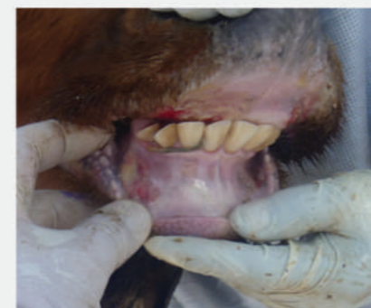
Έλκη και διαβρώσεις στα ούλα βοοειδούς