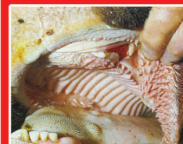
Έλκη και φυσαλίδες στην γλώσσα